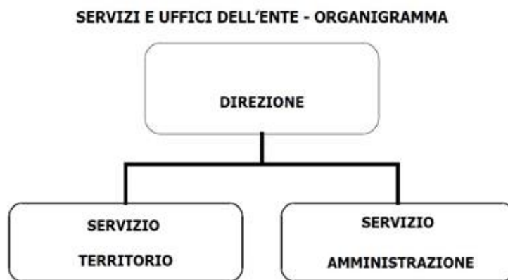
Fig. 2 – Assetto organizzativo dell'Ente nel 2023

A seguito del Decreto del Presidente del Consiglio dei Ministri 23.01.2013 concernente la rideterminazione effettuata in attuazione delle disposizioni dell'art. 2 del decreto legge 6 luglio 2012, n°95 convertito dalla legge 7 agosto 2012, n°135 è stata definita la dotazione organica dell'Ente che prevede, oltre al Direttore, n°21 unità di personale dipendente così distribuito (alla data del 31.12.2021):