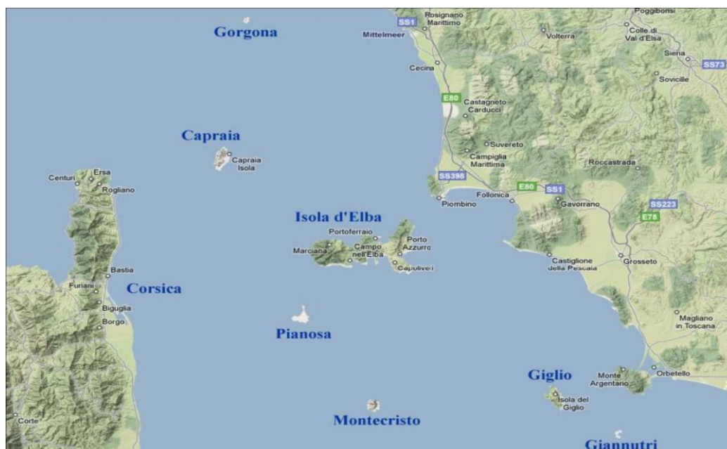
Fig. 1 – Inquadramento del territorio incluso nel Parco Nazionale Arcipelago Toscano